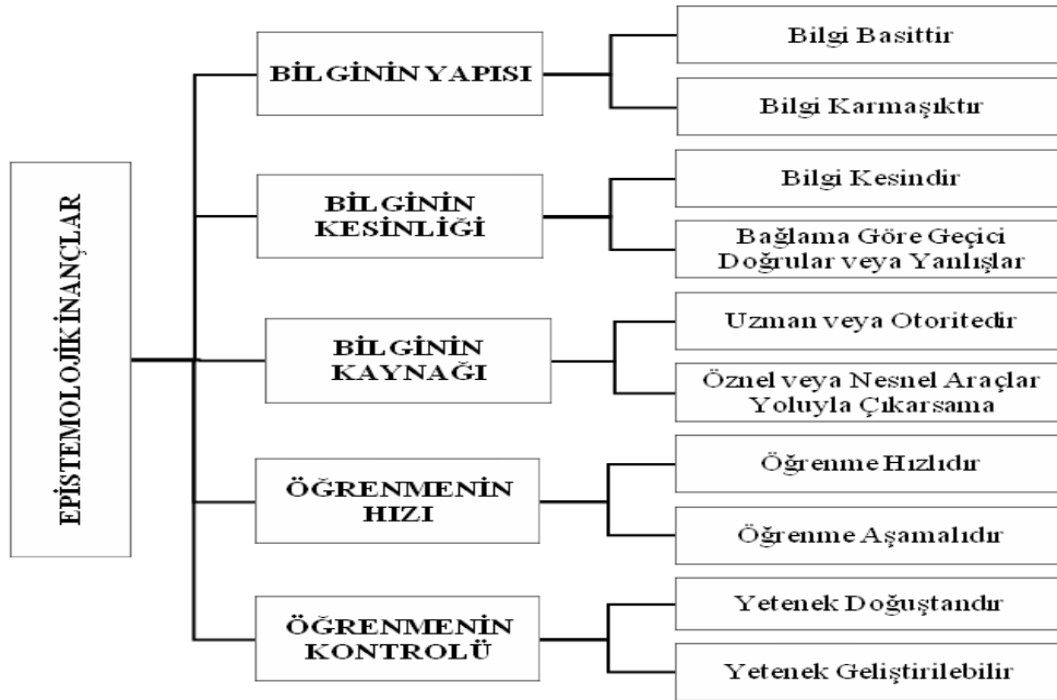
Şekil 1. Schommer Epistemolojik İnanç Sisteminin Çok Boyutlu Yapısı

Epistemolojik gelişim modellerinin kişilerin bilgiye ve bilgi edinimine dair inançlarını aşamalı bir şekilde tek boyutlu ele almaları Schommer (1990; 1994) tarafından eleştirilmiştir. Ona göre böyle bir durum, epistemolojik inançların karmaşık yapısının anlaşılmasına ve epistemolojik inançlar ile öğrenmenin değişik yönleri arasında kurulan çoklu bağlantılara engel teşkil edebilir. Bu nedenle epistemolojik inançların çok boyutlu bir yapıda ele alınması gerektiğini belirtmiştir. Schommer (1990, 1994) epistemolojik inançların çok boyutlu ve birbirinden bağımsız yapısını ortaya koyan bilginin kesinliği, yapısı, kaynağı ile bilgi ediniminin (öğrenmenin) hızı ve kontrolü boyutlarını kapsayan epistemolojik inanç sistemi adını verdiği bir model öne sürmüştür. Schommer'ın çok boyutlu epistemolojik inanç sistemi Şekil 1'de gösterilmiştir.