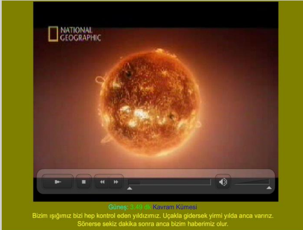
Resim 3: Güneş kavramının görsel ve işitsel hazırlanan ara yüz sayfası