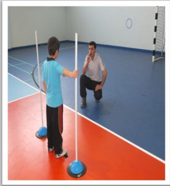
Reaksiyon Egzersizleri (görsel-işitsel)