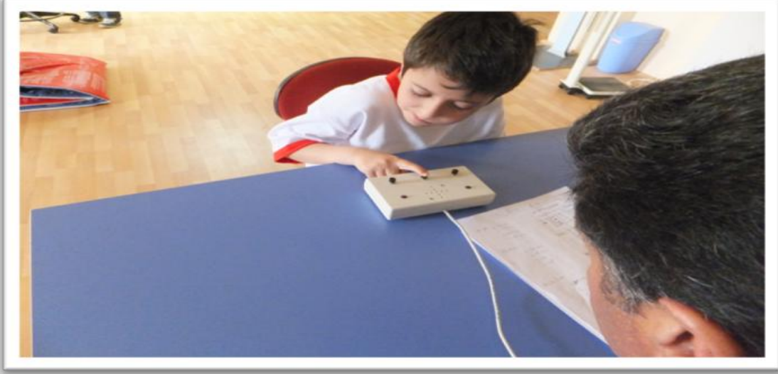
New-test 1000 Reaksiyon Ölçme Aleti